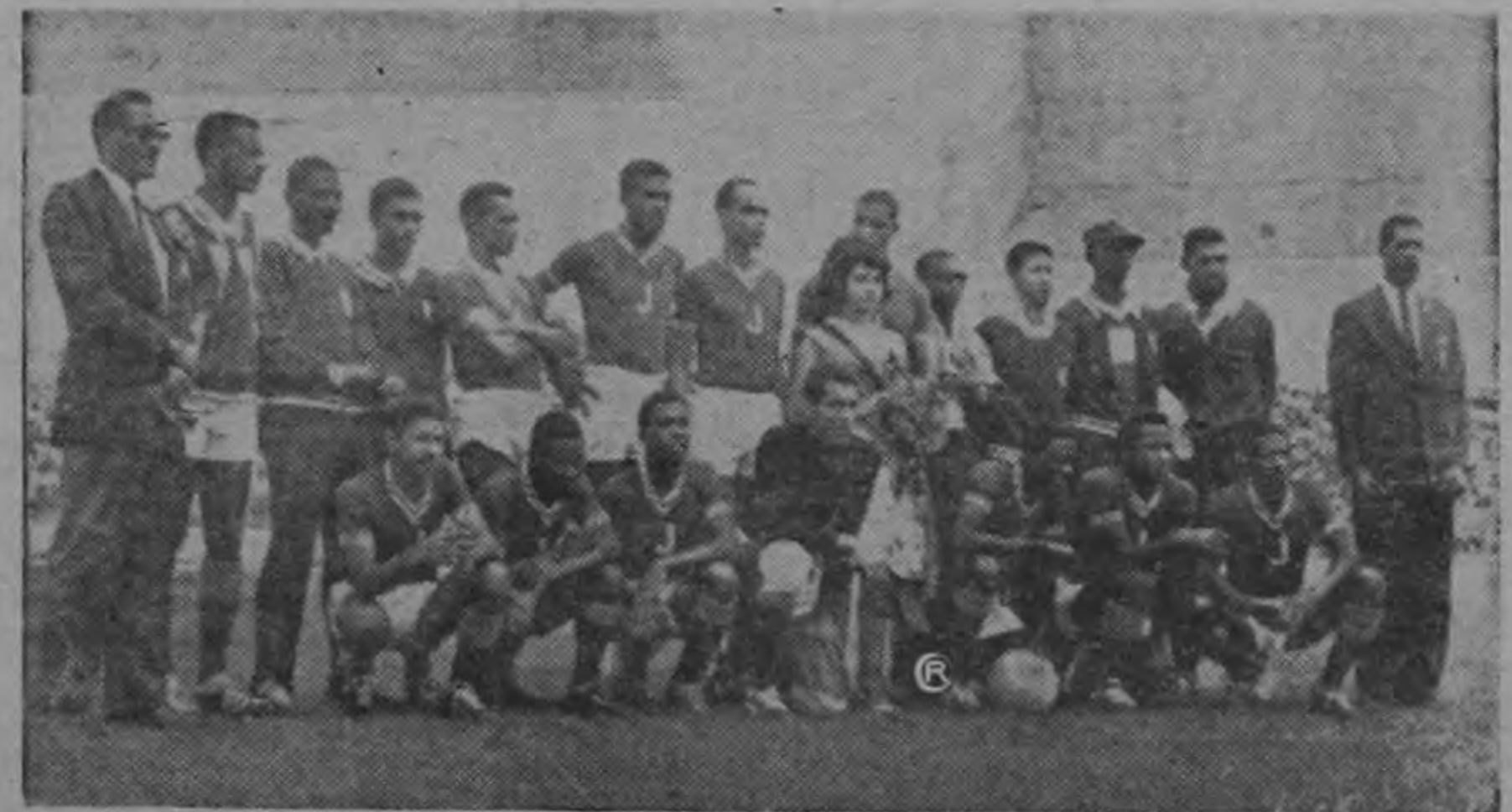
La selección de Jamaica efectúa hoy su último partido en el Campeonato Centroamericano, Norte y del Caribe de Fútbol. Son la centésima del torneo, ya que en sus dos presentaciones no han logrado un sólo gol y han permitido catorce. Hoy juegan contra Curazao y el vaticano es que también serán goleados.