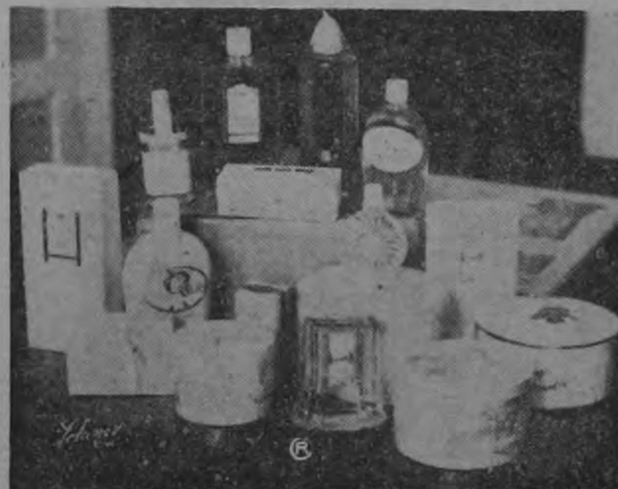
Los productos que fueron robados ayer en la avenida 6ª entre calles 20 y 22 un lote de frascos de perfume, talcos y esencias, los cuales con nombres extraños se les daba la impresión de ser productos extranjeros.