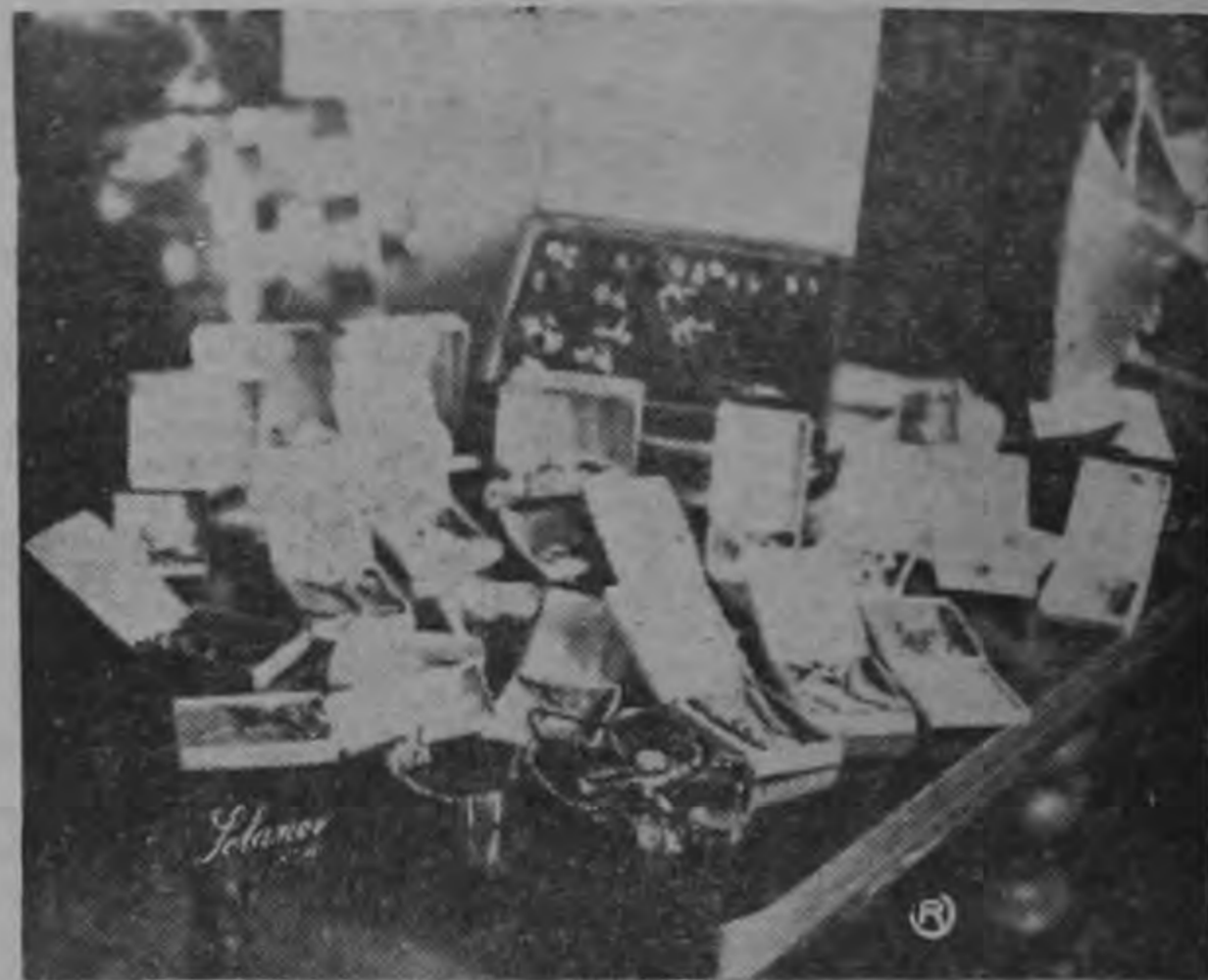
VISTA PARCIAL del enorme botín, recolectado por los detectives tras pacientes investigaciones que les condujeron a través de una docena de poblaciones.

Los autoridades judiciales del lugar inmediatamente iniciaron la instrucción sumarial correspondiente.