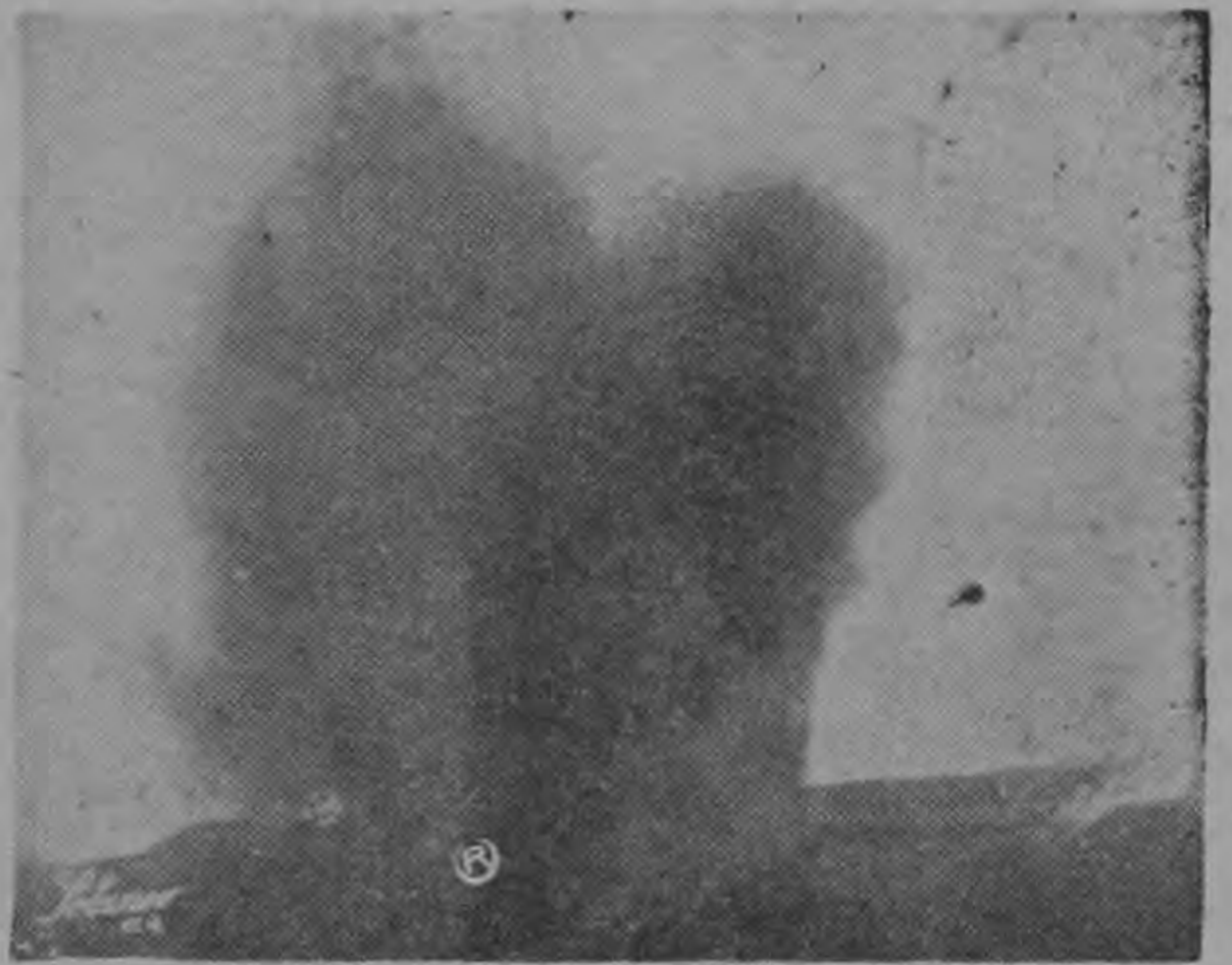
Otra gráfica aérea tomada ayer cuando el Irazú parecía estar en relativa calma, pero continua la "lluvia de ceniza".