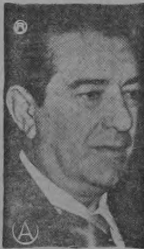
LOPEZ MATEOS... fue recibido en Yugoslavia...

BELGRADO, 29. AP— Docientos mil entusiastas ciudadanos de Belgrado dieron hoy cálida bienvenida al Presidente Adolfo López Mateos, que llegó en visita de estado de tres días.